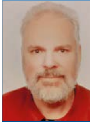
Thomas Gerner Listenplatz 3

Die kaufmännische Angestellte ist langjährige Vorsitzende des Kaninchen- und Geflügelzuchtvereins Lorsbach e.V. sowie des Lorsbacher Vereinsringes. Sie organisiert mit ihrem Vorstandsteam die alljährlichen Frühlings- und Weihnachtsmärkte in Lorsbach.